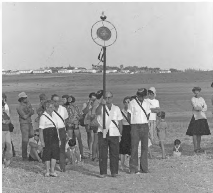
קבלת אות הקוממיות בשנת תשמ"א

במשך שלושים שנה סירבה מדינת ישראל להכיר בלוחמי בארות יצחק ולהעניק להם את אות הקוממיות שניתן ליישובים שנטלו חלק במערכה.