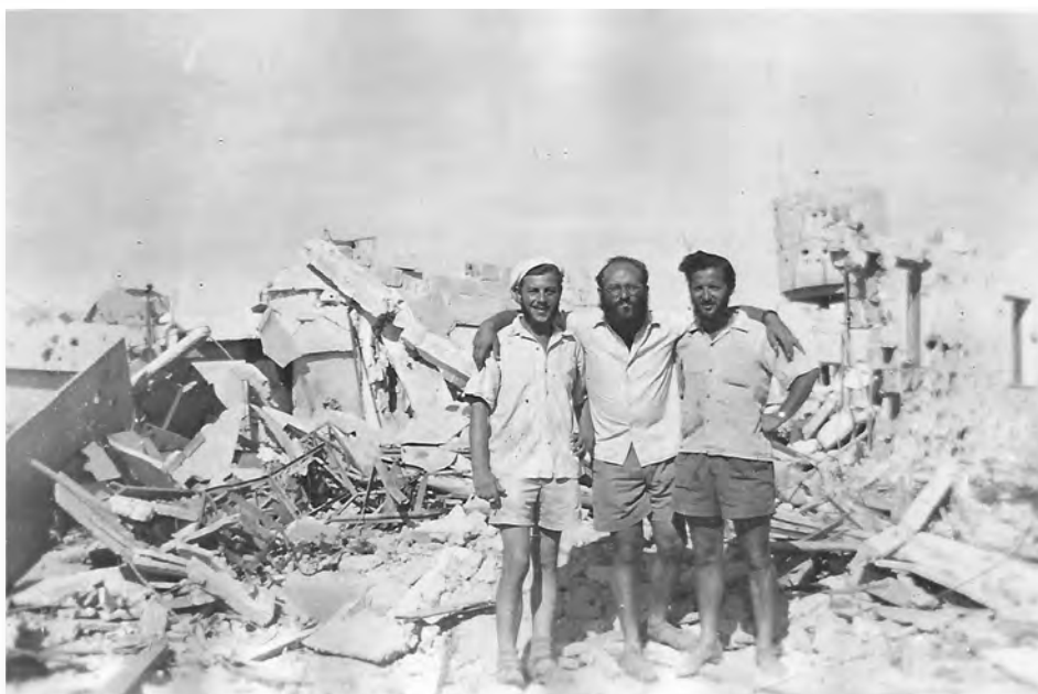
אחרי הקרב בבארות ההרוסה