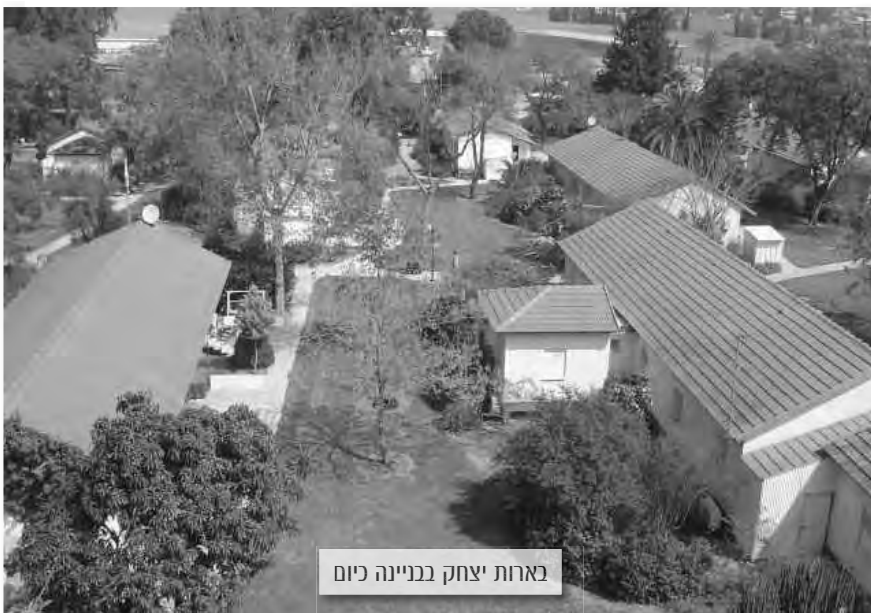
בארות יצחק בניינה כיום

עשר שנים אחרי מפגש הזיכרונות, במלאת 60 שנה לקרב ההוא, הוזמנו כל חברי גרעין עצמאות לערב זיכרון בבארות יצחק. הערב הוקדש לחללי הקבוצה במלחמת השחרור ובכללם שלושת חברי הגרעין שנפלו על משמרתם. לקראת האירוע רואיינו החברים ובמסגרת התוכנית הובא סיפורם המרתק ותרומתם המכרעת להגנת הארץ. חברי בארות יצחק מקווים שערב הזיכרון וחוברות ההנצחה שיצאו בעקבותיו מביעים את ההערכה לה ראויים לוחמי גרעין עצמאות.