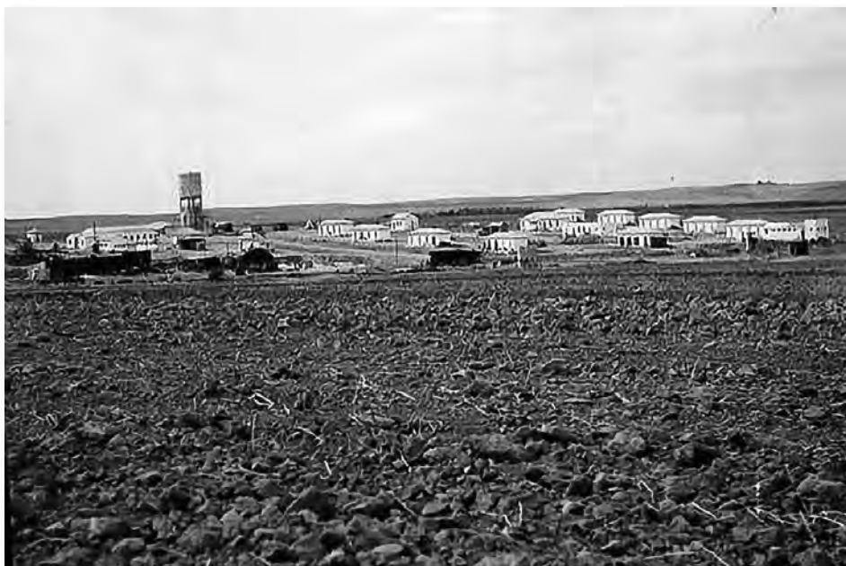
בארות יצחק בשיא פריחתה