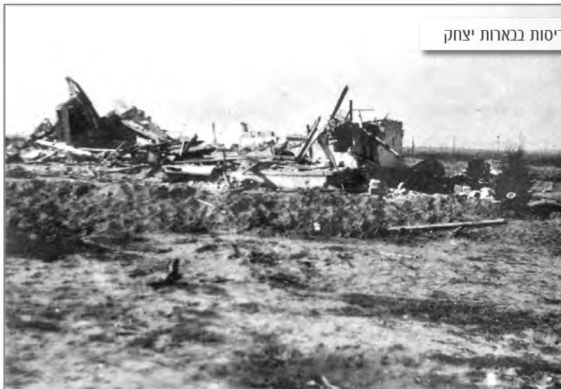
הריסות בבארות יצחק