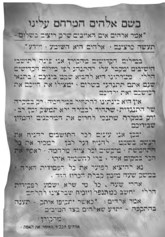
כוח שפוזר ע"י המצרים בישווי הנגב

בקרב זה נפלו 17 לוחמים ונפצעו 15. לאויב נפגעו כ-200 איש.