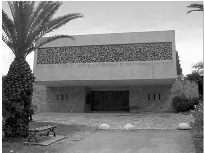
בית הכנסת אהל יצחק בבארות יצחק

ברכת השחייה פתוחה בשעות נפרדות לנשים, שעות לגברים ושעות לבילוי משפחתי. כמו כן מתקיימת פעילות באולם ספורט ובמגרש כדורגל ובמרחבי צעידה למעוניינים.