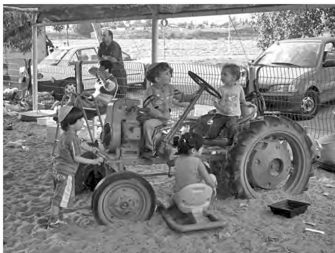
ילדים בבארות יצחק

בבארות יצחק 105 משפחות, מהן 85 משפחות חבריים ולהן 135 ילדים. 45 בנות ובנים משרתים בש"ל ובצה"ל. וכן כארבעים בנים בוגרי צבא, שטרם החליטו על דרכם בעתיד. עוד חיים אתנו הורי חבריים, כמה משפחות תושבים וילדיהן. על אלה יש להוסיף עשרות עולים צעירים, תלמידי האולפן לעברית, כמה חיילים שהוריהם בחו"ל ובנות ש"ל.