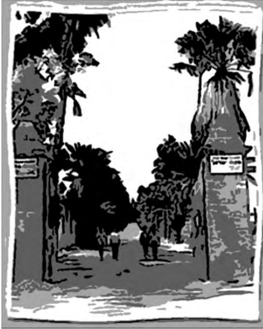
שער "מקווה ישראל"